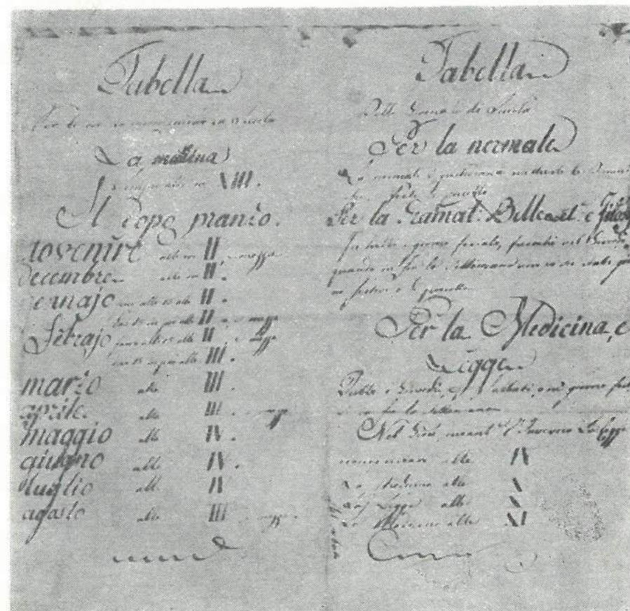
Slika br. 3. Tabele koje su određivale 1806. god. vrijeme studija medicine i prava god. 1806, u Kolegiju sv. Lazara u Trogiru.