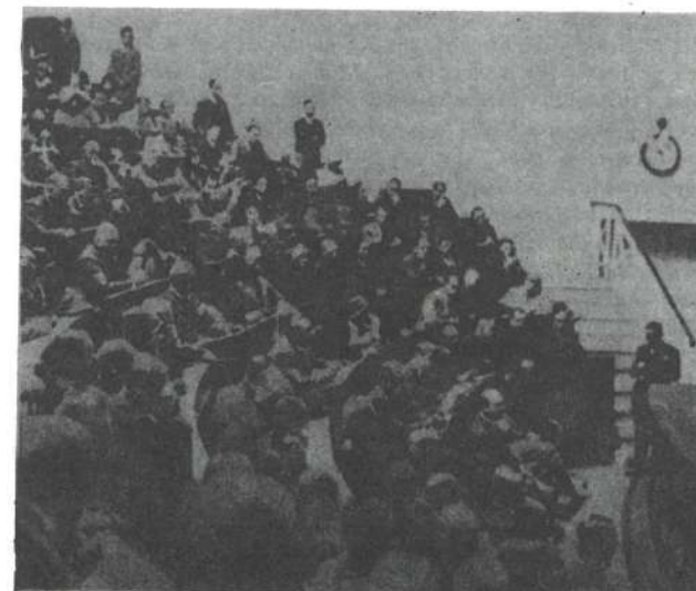
Slika br. 7. Svečana akademija u Amfiteatru Fiziološkog i Histološkog instituta Medicinskog fakulteta u Beogradu