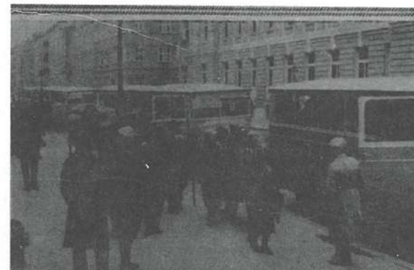
Slika br. 1. Čehoslovački i poljski liječnici obilaze autobusima Zagreb.