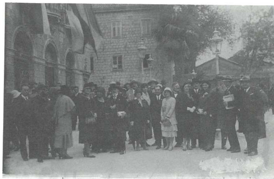
Slika br. 5. Učesnici III sveslavenskog liječničkog kongresa u Splitu 1930. god. ispred Kazališta u Splitu u kojem se održavao kongres

Iz kronologije jasno se razabire plan boravka inozemnih liječnika po Jugoslaviji od 1. do 16. listopada 1930. godine. Zborno mjesto bio je Zagreb 1. i 2. X, kongres je održan u Splitu od 5. do 8. listopada, a iz Beograda su otputovali 16. listopada 1930. godine.