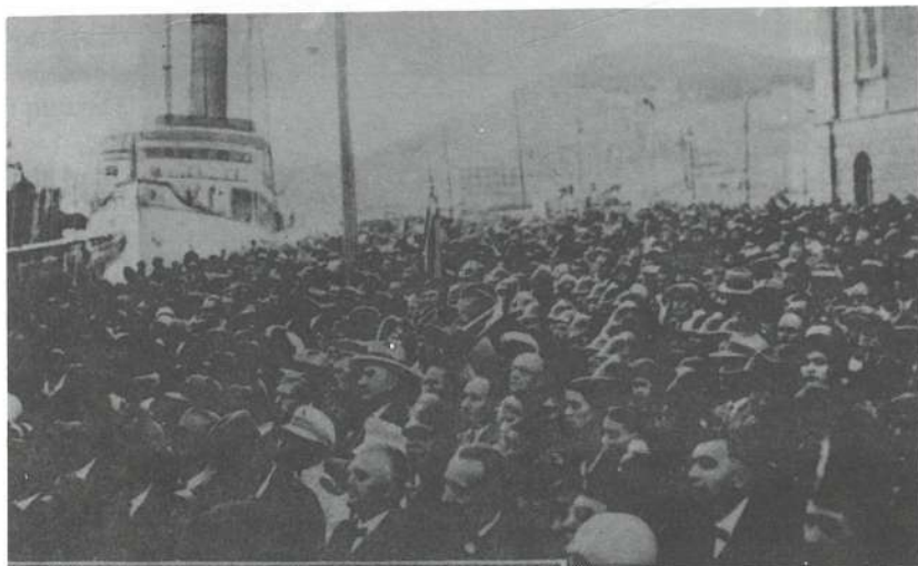
Slika br. 4. Brojno građanstvo Splita oduševljeno dočekuje na Štrossmajerovoj obali učesnike kongresa