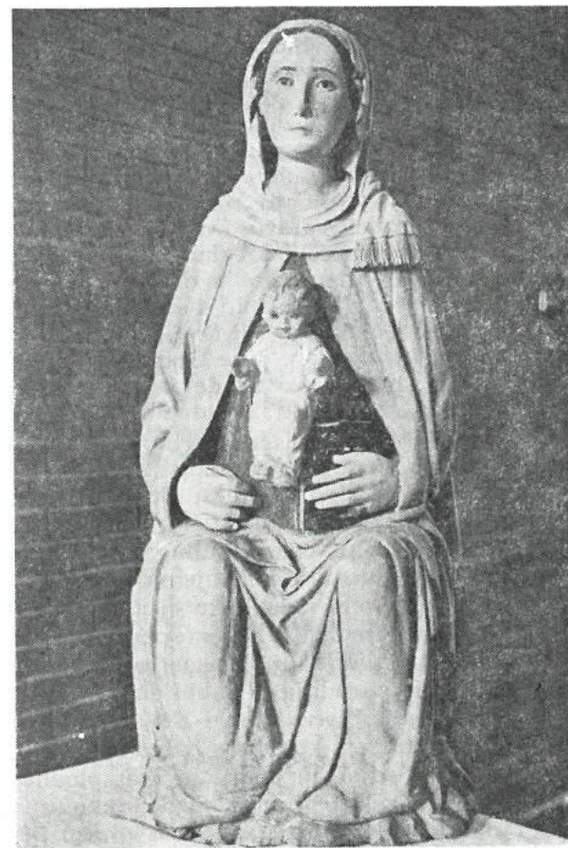
Slika br. 5. Kip trudne Bogomaterne (Gospe od Milosti sa Isusom Hristom) u oltaru crkve posvećene Začeću Isusa Hrista u samostanu na Otoku Gospe od Milosti Krtolskog arhipelaga (kraj XVI veka — rad Jakoba Kotoranina?).

bliže okoline sa lokacije potonulih gradova ili sa ostrva Stradioti, zajedno sa mnoštvom drugog materijala kojim je nasipano i ograđivano ostrvo Gospe od Milosti. A mogao je nastati i tu gde se nalazi”. 20 Eventualno nalaženje drugog dela ovog žrtvenika na nekom mestu na Otoku ili van njega doprinelo bi sigurno razrešenju ove važne dileme, pri čemu je od sekundarnog značaja pitanje gde je nastao tj. gde je klesan. Mnogo važnije je gde se on nalazio prvobitno u svojoj sakralnoj funk-