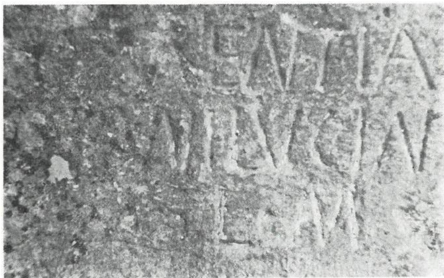
Slika br. 4. Deo uklesanog votivnog natpisa na žrtveniku Junoni Lucini.

predhrišćanskog svetišta posvećenog Junoni Lucini boginji zaštitnici porodilja, porođaja i plodnosti. 19, 23 V. Kostić, iako prevashodno smatra da je ovaj žrtvenik oduvek stajao kao takav u celini na samom Otoku, dopušta i mogućnosti: „možda je on na ovo ostrvce i donijet ali iz