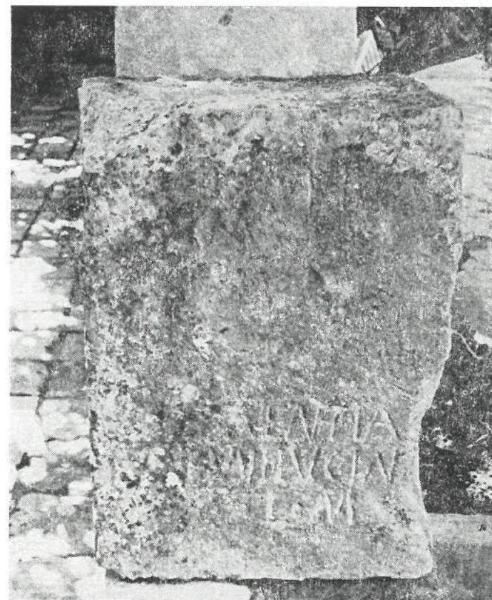
Slika br. 3. Žrtvenik Junone Lucine sa votivnim natpisom u dvorištu samostana na Otoku Gospe od Milosti u Krtolskom arhipelagu (Foto A. Marković, Centar za kulturu, informisanje i dokumentaciju, Tivat).

Od prvog opisa (1903) ovoga, koliko nam je poznato, unikatnog kamenog rimskog spomenika u našoj zemlji posvećenog boginji Junoni Lucini (slavila se 1. dana marta tj. na martovske kalende), veći broj autora je navodio njegovo postojanje i davao izvesna tumačenja njegovog porekla, tj. mesta prvobitne lokacije i sl. (Butorac 7 ; Luković 9 ; Stjepčević 10 ; Šerović 14 ; Moškov i Zloković 11 ; Zloković 15 ; Bešić i sar. 13 ; Otović i Stamatović 12 ; a posebno u više mahova V. Kostić 27 19' 20' 21). Interesantno je napomenuti da autori dva značajna monografska dela o Boki Kotorskoj (Nakićenović 16 , odnosno o Crnoj Gori (Mijović 17, 18 ne spominju uopšte ovaj značajan arheološki nalaz. Autori koji na ovaj ili onaj način, spominju ovaj votivni natpis, mogu se podeliti u tri grupe u zavisnosti od mišljenja koje izražavaju u vezi sa prvobitnom lokacijom