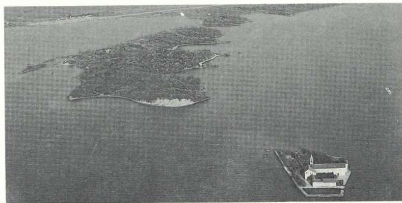
Slika br. 1. Ostrvo Svetog Gavriila

Arhandeli su propovijedali milosrđe, naročito prema gubavcima i drugim nesrećnicima. O tim propovijedima arhandela Gavriila pisao je evanđelista Luka, a pisao je i o Gavriilovim nagoveštajima radosnih događaja, koji su se obistinili: "I odgovarajući anđeo reče mu: ja sam Gavriilo što stojim pred Bogom, i poslan sam da govorim s tobom i da ti javim ovu radost... A u šesti mjesec posla Bog anđela Gavriila u grad Galileju po imenu Nazaret... I reče joj anđeo: ne boj se Marija! Jer si našla mislost u Boga. I evo, zatrudnićeš i rodićeš sina, i nadjeni mu ime Isus" (gl. 1, t. 19, 26, 30. i 31.)