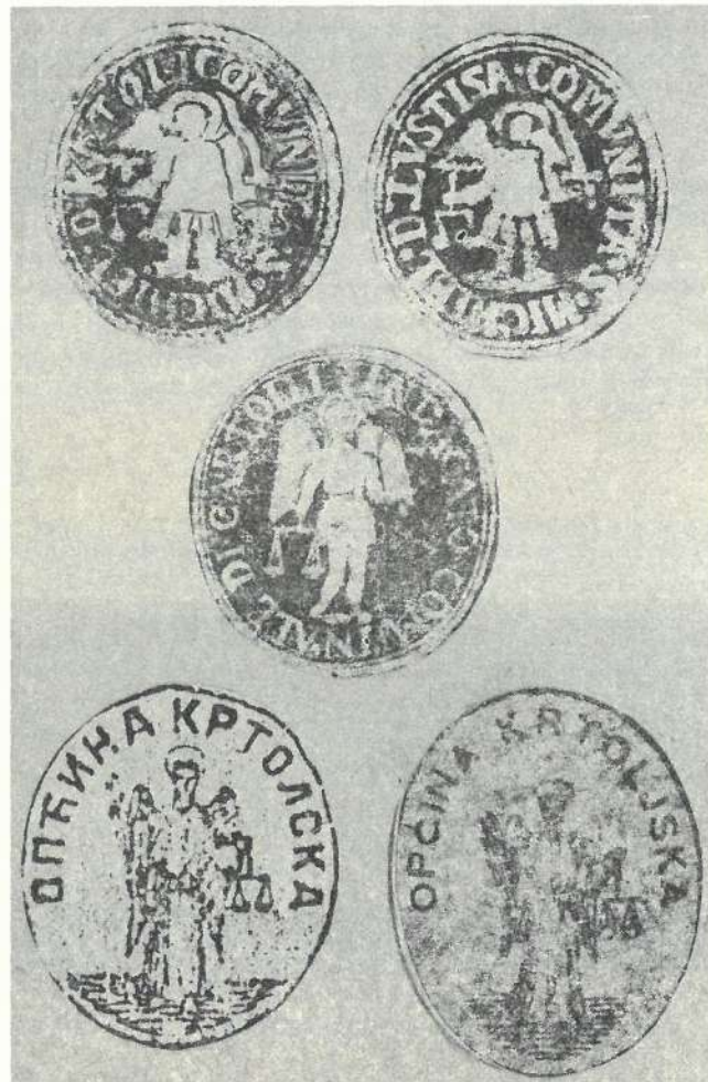
Slika br. 3. I red: Identični otisci krotoljskog i lušičkog pečata iz doba mletačke okupacije; II red: Otisak krotoljskog pečata iz 1866. god. sa natpisom "Sindicato comunale..."; III red: Identični otisci ćirilnog i latiničnog pečata iz doba druge austrijske okupacije.

Pojam "karantin" dolazi od "kvarantin" (ital. quarantina, franc. quarantaine, njem. Quarantne, itd.) u značaju četrdesetnice ili 40 dana. Vjerovalo se da se tačno toliko dana zadržava duh umrlog oko kuće ili groba dok se ne smiri, kada mu se održi parastos "četrdesetnica". Negdje je to mjesec, odnosno 30 dana. Vjerovalo se i da je toliko, 40 ili 30 dana, potrebno svakoj bolesti da se otkrije, pa je negdje za izolaciju uveden karantin, a negde trentin.