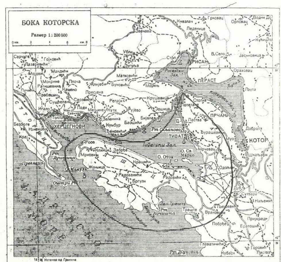
Slika br. 4. Ganice Miholjskog zbora, odnosno Miholjske metohije (meteha, države).

Poznato je da je Mletačka Republika uvela instituciju karantina već 1347. god., što znači ranije nego što je zavladała Bokom. U Dubrovniku je odlukom Velikog vijeća jula 1377. god., uveden trentin. To što nema sačuvanog pismenog dokumenta, ne mora da znači da na ostrvu "Sveti Gavrilo" u to vrijeme nije postojao neki oblik sanitarne ustanove, tim prije što su u to vrijeme svi politički i trgovački poslovi Dubrovačke Republike i Svetomiholjske mitropolije bili izvadredno prisni. Mletačka Republika je okupirala Boku 1420. god., a prof. Risto Kovijanić i don Ivo Stjepčević saopštili su da su našli prvi podatak da je jedan brod zadržan u karantinu u Boki 1431. god., pred Đurićima, kada se vraćao iz Molfete (str. 14). Očigledno se tu nije radilo o karantinu kao organizovanoj ustanovi ili sanitarnom objektu, već je brod zadržan na sidrištu u tjesnacu Verige. Tako se postupalo u mnogim lukama i prije i kasnije, a za Kotor to nije bilo neobično, ako se zna da je predhodne (1430). godine Kotorom harala strašna kuga, kada je svak biježao iz Kotora, bilo kopnom ili brodovima.