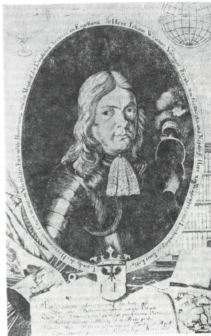
Slika br. 1. Janez Vajkard Valvasor (1641—1693)

VII knjiga piše o veroispovestima, najpre o paganstvu, te pokrišćavanju, zatim o protestantizmu i protivreformaciji, govori i o tadašnjim običajima i praznoverju.