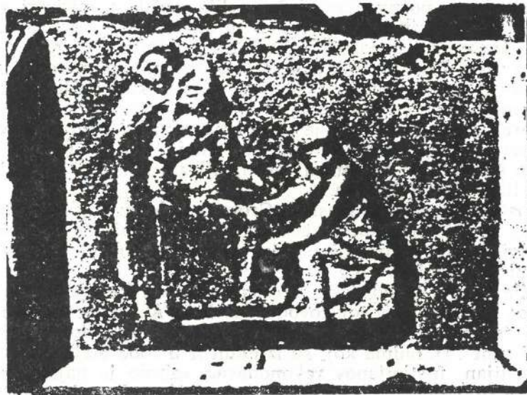
Slika br. 1.

Oskudni su stariji izvori o porođajima, a pogotovu o operacijskim zahvatima u vezi sa porođajima. To je razumljivo, budući da u anticko doba pomoć u porođajstvu nije potpadala pod zdravstvenu znanost. I svećenici-lijeknici, od kojih imamo neke vrlo oskudne podatke, nisu dali osvrt o umijeću pri porođajima, koje su prepuštali ženskim osobama, što potvrđuju rijetke slikovne zabilježbe na nekim zidovima i stijenama u hramovima, gdje je uz roditelju babica i ponekad dadilje (slika br. 1).