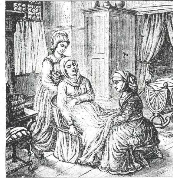
Slika br. 4.

opisuje tehniku izvedbe uzdužnog trbušnog reza na lijevoj strani trbuha, gdje ima više mjesta „budući da je na lijevoj strani jetra“.