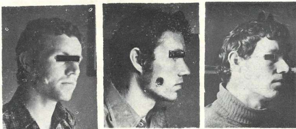
Slika br. 2. Izgled našeg drugog bolesnika prije, za vrijeme i poslije liječenja

Koliko je ovakvo „liječenje” bolno ilustruje izjava samog vidara. Vidar prije početka liječenja saopštava jednom bolesniku: „Ako imaš što od oružja skloni ga, jer će ti doći da se ubiješ od bolova”.