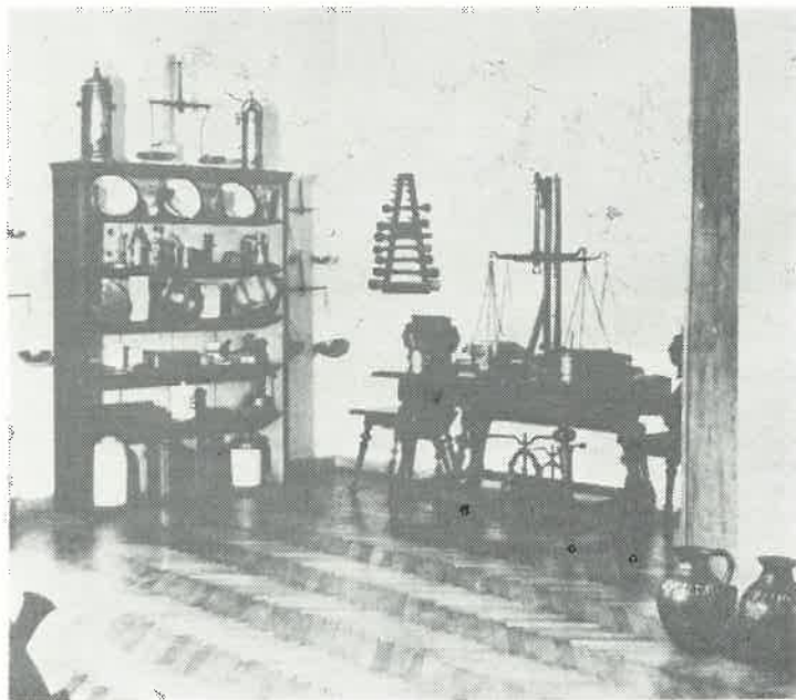
Slika br. 4. Laboratorijski deo historijske farmaceutske zbirke (Pokrajinski muzej, Maribor)

Od porculanskih lončića ističu se naročito proizvodi bečke porculanske industrije, koji su iz Ptuja, te imaju zlatnu kuglicu na poklopcu.