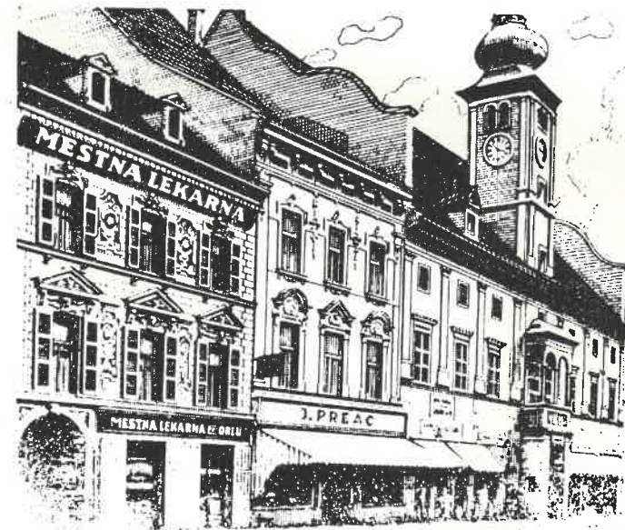
Slika br. 1. Gradska apoteka „Kod orla”, Glavni trg, Maribor