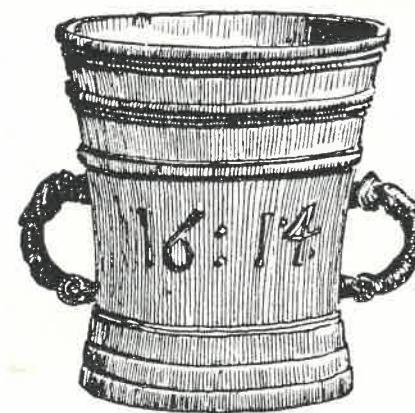
Slika br. 5. Apotekarski mužar iz Slovenske Bistrice (Pokrajinski muzej, Maribor)

Na stepeništu mariborskog zamka, koje vodi na prvi sprat Muzeja, primećujemo pored drugih kipova (figura) takođe one koji prikazuju Kemiju, Farmaciju i Kozmetiku. Farmaciju označava lončić, kojeg drži dečak u desnoj ruci, i apotekarska posuda, koju drži u levoj ruci. Kip kemije drži u desnoj ruci trouglastu topionicu, a u levoj retortu za destilaciju. Kozmetiku prepoznajemo po pudrijeri (puderskoj dozi)” 2