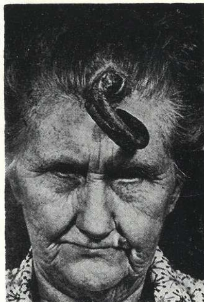
Slika br. 4. Slika 69-godišnje žene s rogom nasred čela.

Vrlo impresivnu sliku takvog roga i opis donosi R a y iz Toronta, pa je donosimo i mi (sl. br. 4), radi vrlo i naročito impresionantnog izgleda. Radi se o 69-godišnjoj ženi, kojoj je rog izrastao u sredini čela, a na samom rubu kose. Žena je izjavila da je pred 20 godina postojao na tome mjestu samo „prišt“-oteklina, koja se sama otvorila i ispraznila.