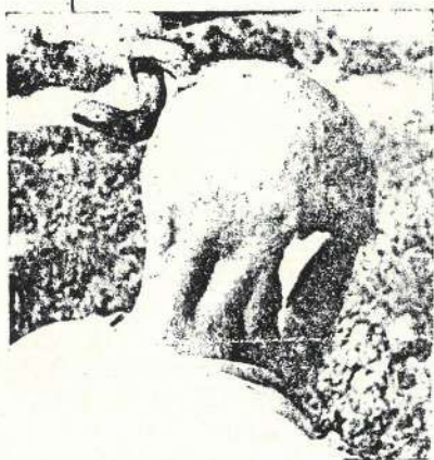
Slika br. 3. Slika glave s rogom ratara iz Bosne (iz zbirke prim. dr A. Goldbergera, Zenica).

Literatura navodi da ima rogova koji vrlo sličie kako po boji tako i po obliku te konzistenciji pravom ovčjem rogu, iako su izrasli iz mekog oglavka, a ne iz pokosnice ili lubanje.