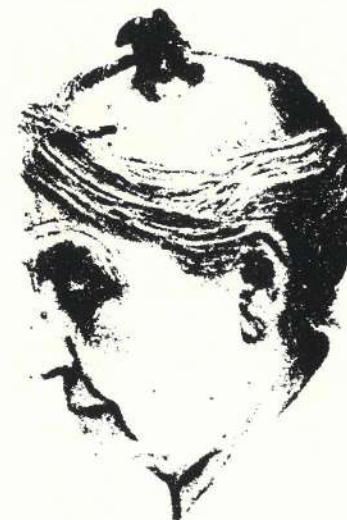
Slika br. 5. Rožna izraslina na sred glave žene.

Grotesknu formaciju izrasline kožnog roga okosnice oglavka prikazuje uz sliku K l o s e (sl. br. 5) uz tekst „Groteskne forme izrasline na sred glave među kosom bolesnice“.