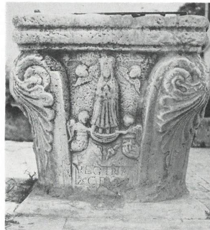
Slika br. 3. Kruna bunara (druga strana) spomenutog Doma u Trogiru.

Pored tog povećanja svote za izdržavanje Liceja, sastavljač ove molbe je predložio da se ta nova školska ustanova premjesti iz samostana sv. Lazara u gradski samostan sv. Dominika, kojemu bi se moglo