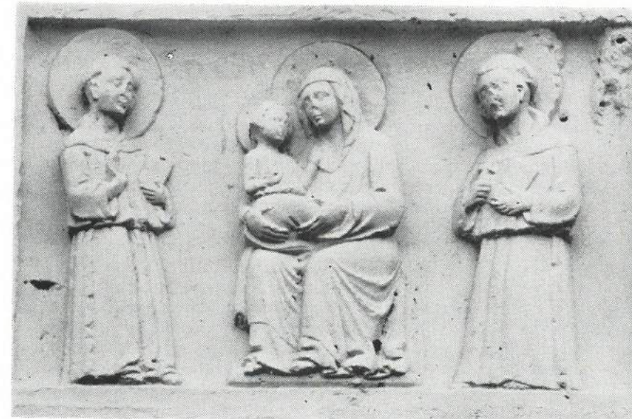
Slika br. 6. Gotički reljef uzidan kasnije na pročelju zgrade spomenutog Doma u Trogiru.

Kruna bunara spada, dakle, pored one sred dvorišta bivšeg samostana sv. Klare, 18 sada gostionice, u Dubrovniku i one u Supetru na Braču 19 među ikonografski najbogatije u Dalmaciji, iako njen klesar nije vrstan; likove je izradio nespretno i loše. Kruna je začepljena, nije u upotrebi i ima samo ukrasnu ulogu, pod njom nije bunar.