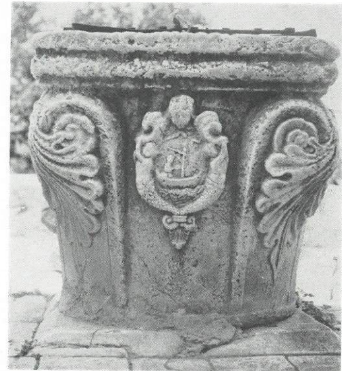
Slika br. 5. Kruna bunara (četvrta strana) spomenutog Doma u Trogiru.

Samoj zgradi Liceja, odnosno ranijih samostana, Kolegija i leprozorija nije se pri gradnji ubožišta 14 davao osobiti spomenički značaj, kao ni mnogim povijesnim zdanjima naše kulturne i likovne prošlosti, iako su pojedini Trogirani cijenili i isticali već oko 1848. značaj tog liceja. Jedan od najvrijednijih Trogirana 19. stoljeća Josip Slade, rodoljub, arhitekt i načelnik u svom zavičaju, koji se do sada malo spominjaše, piše o tome u svom spisu „ Trogirske bijede “, koji sam preveo sa talijanskog i objavio, slijedeće: 15 „ Nekoć među najbogatijim gradovima, Trogir je sveden u krajnju bijedu, te sad ne može uklanjati ni gradsko smeće niti popravljati pločnike svojih ulica. Licej u kojemu se upotpunjavaše nauk učenjem liječništva i zakonodavstva, sveden je na dva redovna, obična razreda, gdje se tako rekavši ne uči razlikovati slova abecede, a učitelje ne plaća država već općina. Tom Liceju inače zbog dobrog odgoja i učenja prilažahu mnogi sa svih strana. “ Slade smat-