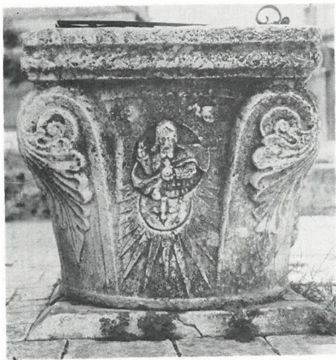
Slika br. 2. Kruna bunara (prva strana) „Doma za odrasle osobe” u Trogiru.

Naobraženi Trogirani su se ponosili a i zauzimali, koliko im njihove skućene mogućnosti onog vremena dopuštahu, za tečajeve. Među arhivskim spisima Ivana Luke Garanjinina sačuvana je molba upućena francuskoj Generalnoj upravi školstva Kraljevine Italije u