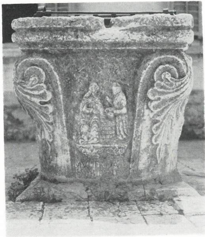
Slika br. 4. Kruna bunara (treća strana) spomenutog Doma u Trogiru.

Prostiraše se dakle uz sjeverni i istočni odnosno apsidalni zid crkve, obuhvataše ju dakle sa dvije strane svojim četvorastim oblikom. Imao je malo zatvoreno dvorište, koje je i danas uz crkveni zid. Sa istočne strane zgradi je bio dodan mali ispust, možda nužnik, a daleko od toga na sjeverozapadnom uglu vjerojatno pločnik nad cisternom s