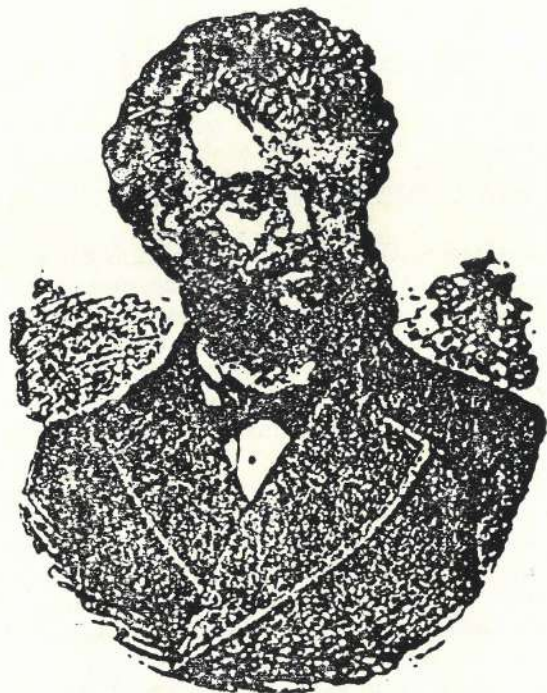
Д-р Јован Пачу. лекар, музичар и композитор

i kod muslimana, koji su ga rado primali u svoje domove, a njihove žene se nisu sakrivala od njega, kako su to činile od drugih. Krasilo ga je dobro zdravlje, bio je uvek raspoložen i čuo za priče i šale. Oko njega se uvek skupljala omladina, kojoj je davao savete iz medicine i muzike.