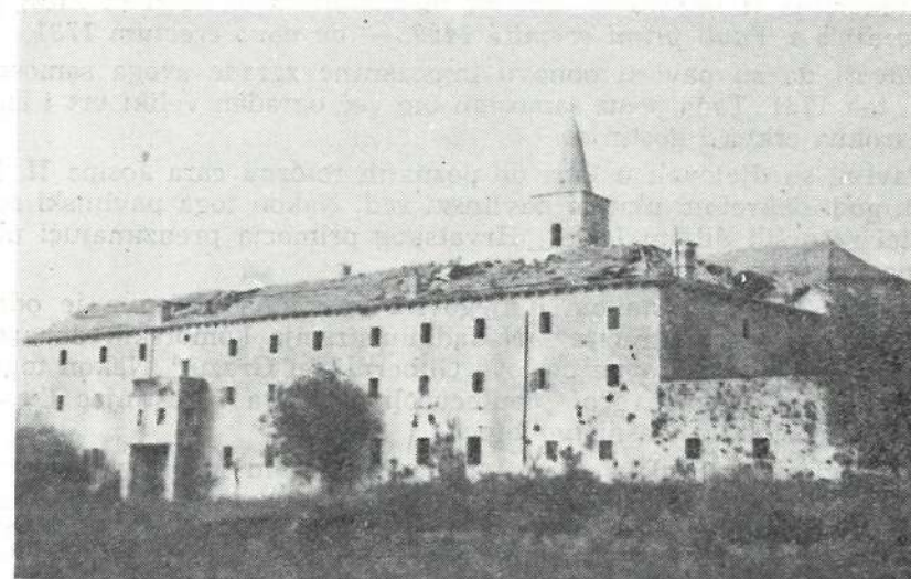
Slika br. 1. Pavlinski samostan danas

Crkveni red pavlina je prema pisanju mnogih povijesničara razvijao u Istri od XV-XVIII stoljeća značajno kulturno djelovanje. Danas još sačuvani spomenik njihovog rada i djelovanja je kompleks zgrada samostana u Sv. Petru u Šumi kod Pazina (slika 1). Ovaj se samostan prvi puta spominje u jednoj indiciji 1176. godine, koja govori o jednom imovinskom sporu, koji je tada vodio opat supetaraskog samostana sa porečkim biskupom Petrom 1 . Kl en 2 citirajući O sto j i e v rukopis o benediktincima u Istri navodi da je to bio jedan od brojnih benediktinskih samostana, koji su ovdje osnovani od VIII-XII stoljeća. Zbog ratova i bolesti koje su harale Istrom od XII-XIV. stoljeća, samostan u Sv. Petru u Šumi je kao i ostala benediktinska sjedišta ostao prazan.