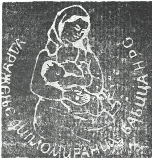
Slika 6. — Korice članske knjižice Udruženja diplomiranih babica NR Srbije

menog školskog medicinskog centra u Novom Sadu, pored ostalih, i sa Odsekom za akušerske sestre, s novim, višim, pozitivnijim kvalitetom — četvorogodišnjim školovanjem. Međutim, ni u prethodnom 10-godišnjem periodu (1954-1964) babički kadar, formiran i školovan u tim babičkim školama u Vojvodini, nije ostao ni stručno, ni društveno neaktivan. U tom periodu delovanje se odvijalo i u okviru Udruženja babica NR Srbije (1951-1961), čiji su aktivni članovi bile i babice s teritorije AP Vojvodine (slika 6).