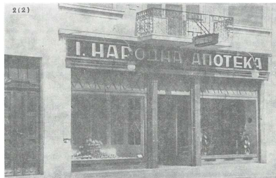
Slika 2. — I narodna apoteka u Vršcu, otvorena 1944. godine, spoljni izgled.

Ova apoteka preuzela je celokupni inventar i prostorije apoteke Schütz-Marich u ul. Žarka Zrenjanina 29.