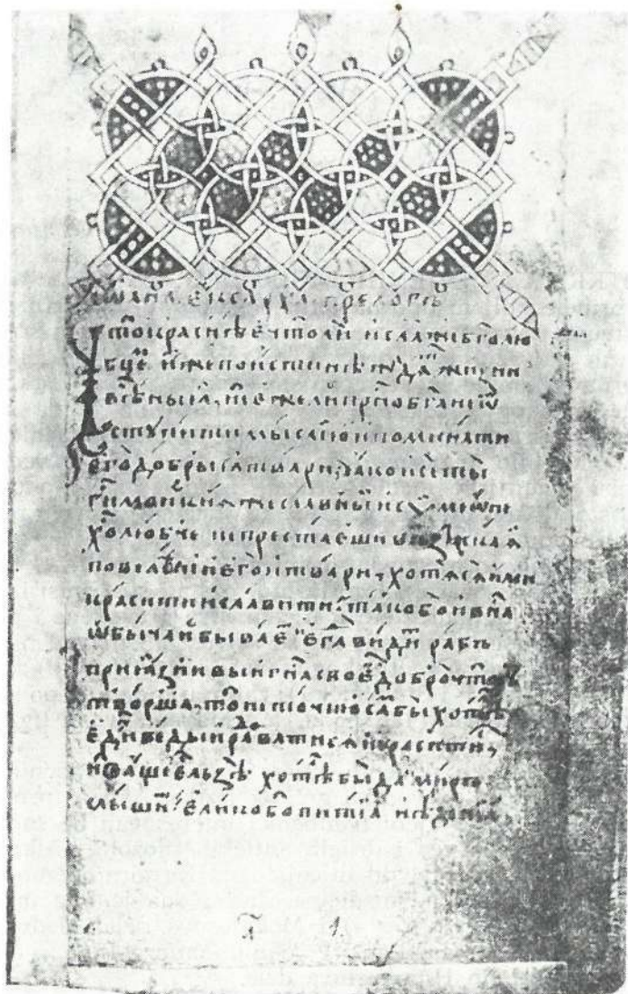
Naslovna strana šestodnevna Jovana Egzarha, rukopis srpske recenzije, XVI vek (Lenjinova biblioteka, Moskva).