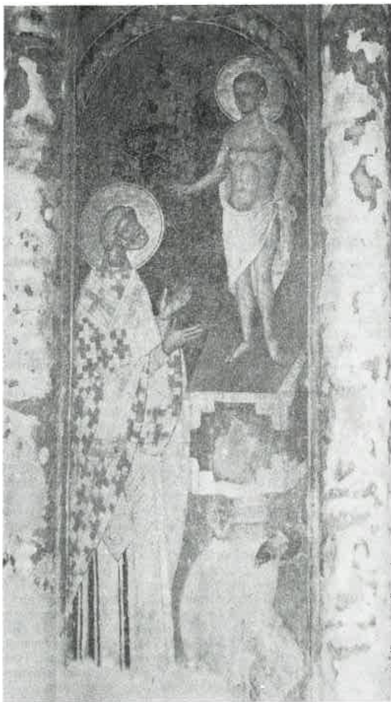
Resava; Vizita Sv. Petra Aleksandrijskog (XV)V. (Hristos kao dečak)

stave koje daju podatke o negovanju deteta. Na jednom mestu kaže: „Kada je govor o detetu, izgleda da je kičica naših starih umetnika redovno odabirala ranu mladost; odraslije dete, zdravo ili bolesno, skoro smo uzalud tražili“ (1) . Postoje, međutim, nekoliko kompozicija na kojima su prikazana i odrasla deca. Pomenućemo samo neke: u kompoziciji „Vizija Petra Aleksandrijskog“ Hristos, koji se javlja Petru, prikazan je kao dečak između 12 i 15 godine, u stojećem stavu, nag, samo sa jednom draperijom preko bedara. Najlepši primeri ove kompozicije nalaze se u Gračanici (1321) (2) i u Manasiji (1406, 1418). U kompoziciji „Hristov ulazak u Jerusalim“ uvek se prikazuju dečaci kako prostiru haljine ispred mazge koju Hristos jaše. Ova kompozicija nalazi se skoro u svim našim spomenicima. U ciklusu o životu sv. Nikole vrlo je česta scena koja prikazuje malog Nikolu u školi u grupi dečaka (Bogorodica Ljeviška — 1307. i Psača — 1366).