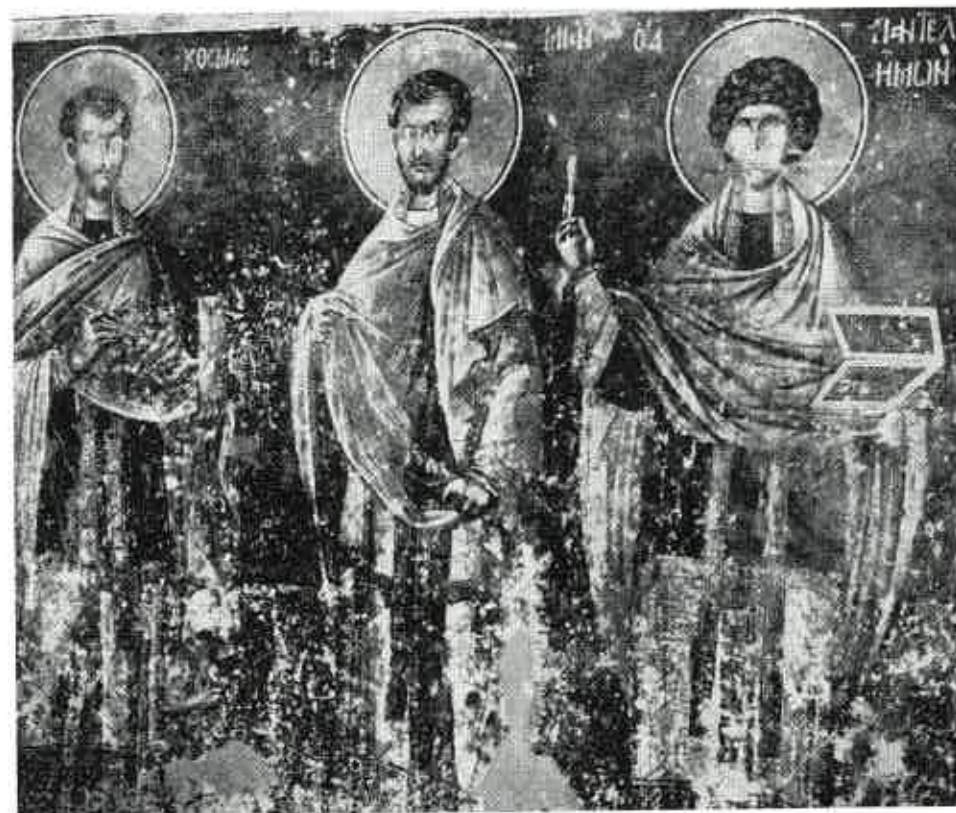
Staro Nagorićino: Sv. Kuzman Damjan i Pantelejmon (1318) g. (sa medicinskim atributima)

Lekari Kir i Jovan živeli su u drugoj polovini III veka. Kir je najpre živeo u Aleksandriji a za vreme Dioklecijanovih progona prešao je u Arabiju, gde se zamonašio i ubrzo proćuo kao iscelitelj. Hagiografski izvori kažu da je on još u Aleksandriji lećio i fizićki lekovima. Jovan je bio najpre oficir u Edesi. Popularnost Kira, zbog njegovih isceljenja, privukla ga je da dođe k njemu u Arabiju i da ostane uz njega. Ubijeni su 311. godine u gradu Kanopu. Legenda o njima je splet proizvoljnosti kasnijih hagiografa, koji su od njih dvojice, kako kaže Lu-