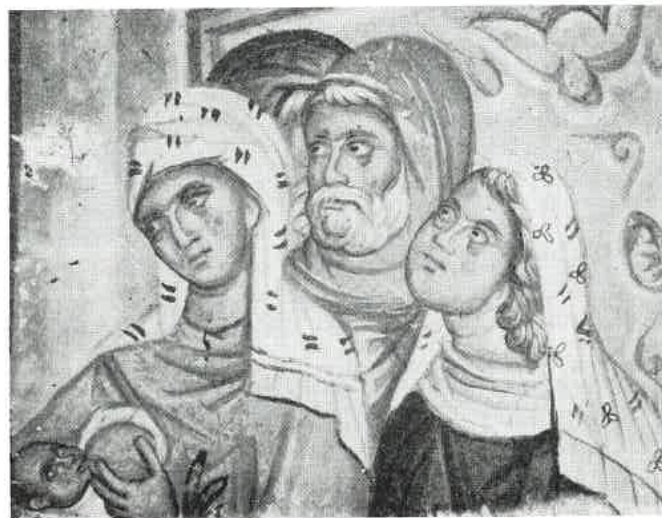
Lesnovo: Ulazak u Jerusalim (Dojilja) (1349) g.

stave koje daju podatke o negovanju deteta. Na jednom mestu kaže: „Kada je govor o detetu, izgleda da je kičica naših starih umetnika redovno odabirala ranu mladost; odraslije dete, zdravo ili bolesno, skoro smo uzalud tražili“ (1) . Postoje, međutim, nekoliko kompozicija na kojima su prikazana i odrasla deca. Pomenućemo samo neke: u kompoziciji „Vizija Petra Aleksandrijskog“ Hristos, koji se javlja Petru, prikazan je kao dečak između 12 i 15 godine, u stojećem stavu, nag, samo sa jednom draperijom preko bedara. Najlepši primeri ove kompozicije nalaze se u Gračanici (1321) (2) i u Manasiji (1406, 1418). U kompoziciji „Hristov ulazak u Jerusalim“ uvek se prikazuju dečaci kako prostiru haljine ispred mazge koju Hristos jaše. Ova kompozicija nalazi se skoro u svim našim spomenicima. U ciklusu o životu sv. Nikole vrlo je česta scena koja prikazuje malog Nikolu u školi u grupi dečaka (Bogorodica Ljeviška — 1307. i Psača — 1366).