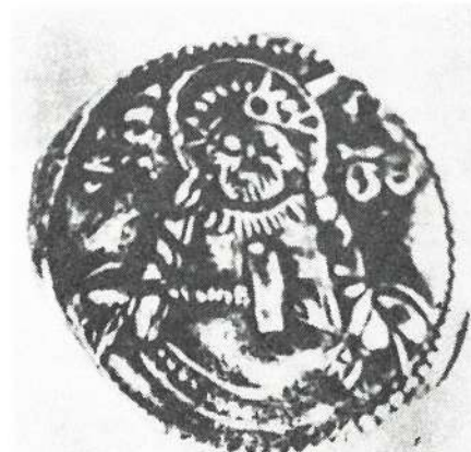
Slika 3. Poprsje Isusa u rudarskoj opremi i sa čekićem