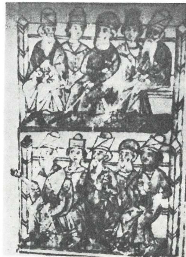
Slika 2. Detalj minijature iz Zakona o rudnicima Despota Stefana Lazarevića

Naša dopuna bogatom komentaru autora ovog dela je da su minijature date u višebojnoj izradi.