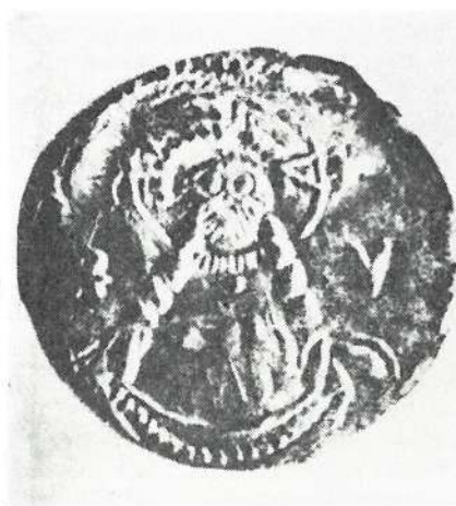
Slika 5. Poprsje Isusa u rudarskoj opremi, ali bez čekića

Na slikama br. 3, 4 i 5 prikazane su same prednje strane novčića, jer su one isključivo bitne za sagledavanje elemenata zaštite na radu.