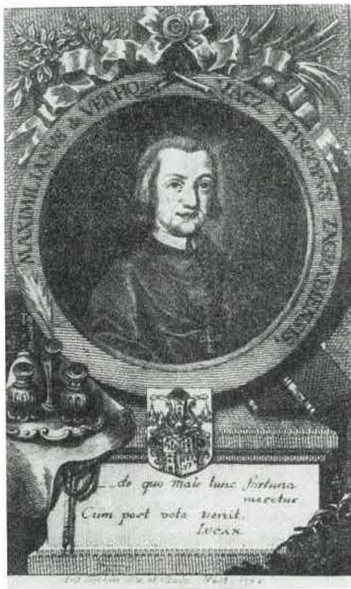
Sl. 1. Maksimilijan Vrhovac godine 1788.

Posebnu pažnju posvećuje širenju jezičke kulture, i u tome smislu upućuje i poznatu poslanicu za skupljanje narodnog blaga godine 1813. 7) koju je namijenio svome svećenstvu. U posljednjim godinama života usprkos staračkoj iznemoglosti Vrhovac još uvijek djeluje na svim stranama. Umire u Zagrebu 16.XII 1827. nakon kraće bolesti u 76. godini života. Možemo reći da je Vrhovac išao manje više onim istim putem kojim je pošla i hrvatska politika godine 1790. i dalje. Naime, u vrijeme dok se u ostaloj Evropi rješava pitanje opstanka zastarjelog feudalnog poretka i dok ga zapadna Evropa godine 1789. eliminira revolucionarnim putem, Hrvatska