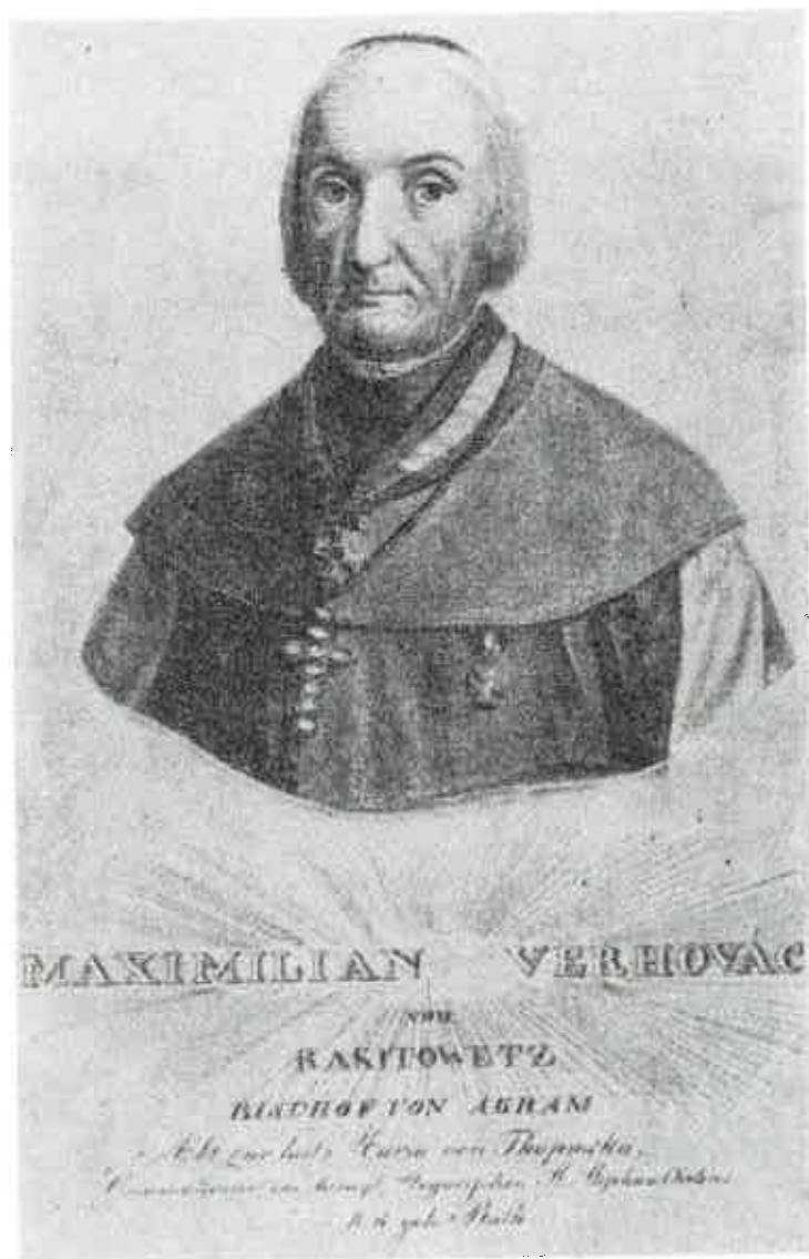
Sl. 5 Maksimilijan Vrhovac oko godine 1825/6

su zabilježeni manje više svi značajniji događaji u vremenskom rasponu sa malim prekidima od godine 1801. 8) do godine 1825. „Diarium“ je pisan Vrhovčevom rukom pretežno latinskim jezikom, uz poneke umetke na njemačkom, talijanskom i francuskom jeziku. Uzmemo li u obzir da je Vrhovac od kraja XVIII st. i početkom XIX st. centralna figura našeg čitavog javnog političkog i kulturnog života onda treba i njegov dnevnik promatrati upravo s toga gledišta. Vrhovac je iz dana u dan pratio zbivanja ne samo u Zagrebu i Hrvatskoj, nego je bio vidno zainteresovan i na svim pojavama i promjenama koje su se zbivale u Evropi početkom XIX stoljeća.