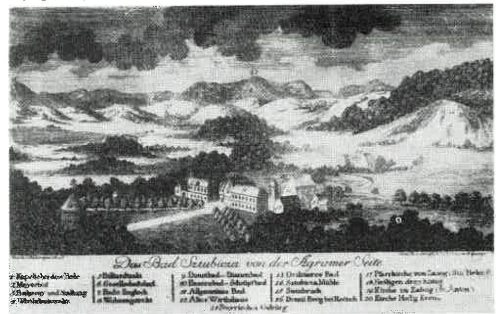
Sl. 4. Stubičke Toplice početkom XIX. st. iz Šifíćeve knjige o Stubičkim Toplicama

Iako o Stubičkim Toplicama postoji zanimljiva i opsežna literatura 28) , smatramo da je ipak vrijedno zabilježiti podatke o istima iz Vrhovčeva „Diariuma“. Vrhovac