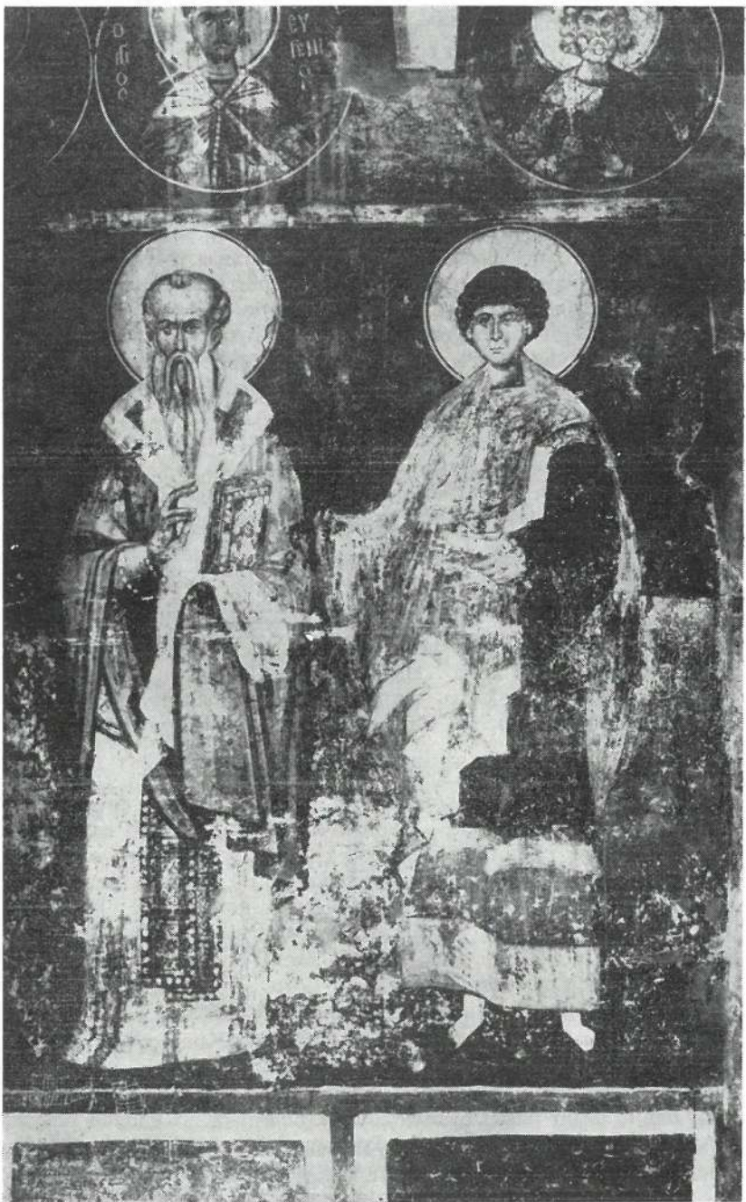
Slika 1 Crkva Sv. Nikole Bolničkog u Ohridu, freska XIV veka — Lik Sv. Klimenta u prisustvu vrača Pantelejmona

mentima, freske s istim sadržajem nalaze se i u drugim crkvama Makedonije. Od posebne je važnosti crkva manastirskog tipa sv. Gavrila arh. Mihajla u Lesnovu.