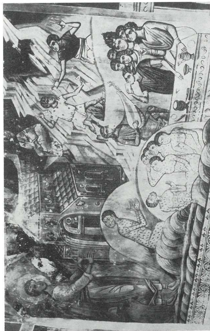
Slika 2 Crkva Sv. Arhandela u Lesnovu, freska iz XV veka — Veselje u čast isceljenja od lepre

mentima, freske s istim sadržajem nalaze se i u drugim crkvama Makedonije. Od posebne je važnosti crkva manastirskog tipa sv. Gavrila arh. Mihajla u Lesnovu.