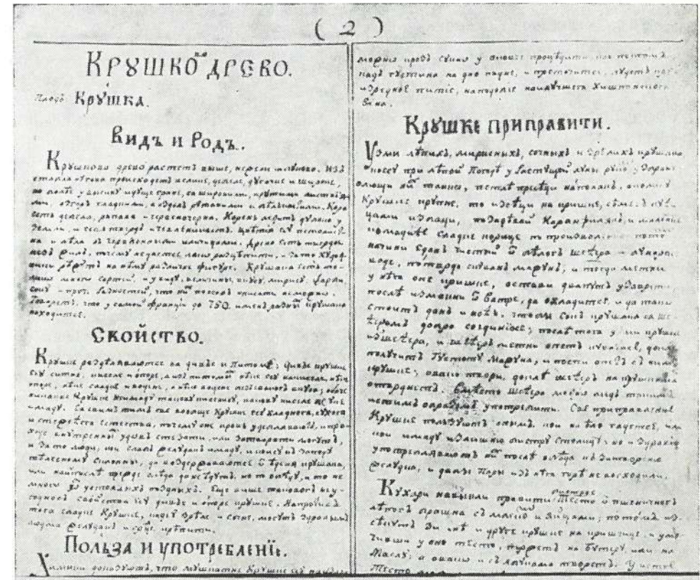
Podaci koje je Orfelin, veoma, dekorativnim i čitkim rukopisom napisao na poledini crteža kruške.

u zabunu čitaoca, — u Orfelinovom su Travniku , manje više, svi crteži ne samo botanički i naučno tačno i precizno rađeni, nego istovremeno ostavljaju utisak izvesne privlačnosti i topline. Mnogi od tih crteža su na nivou pravog umetničkog dela, slični najfinijem vezu, najtananijoj briselskoj čipki, s puno ljupkosti i lepote, a da pri tom nisu izgubili ništa od svoje strogo naučne tačnosti i vernosti uzoru iz prirode. Zbog toga bi se većina tih crteža, bez ikakve rezerve, i danas mogli uneti u udžbenike botanike ili farmakognozije; ima i takvih koji bi mogli zameniti ukras i poslužiti kao prave umetničke slike u radnim kabinetima, ateljema umetnika i ostalih ljubitelja prirode.